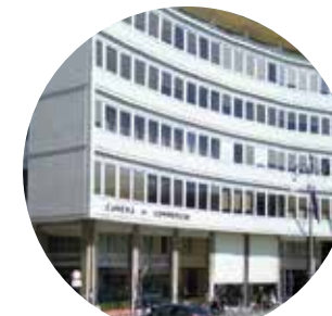
CAMERA DI COMMERCIO