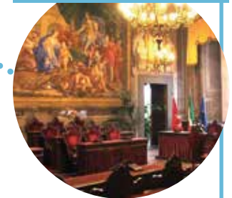
SALA BALEARI COMUNE DI PISA