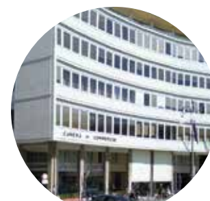
CAMERA DI COMMERCIO

All Junior surgeons and residents are invited to the Junior MD Lunch. The intent of this luncheon is to share ideas and experiences in a convivial and informal context with several Senior thoracic surgeons, which will be announced on October 10th. Registration is required at the time of registration, for a maximum of 25 participants.